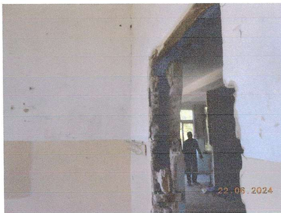
Նկ. 2 Մասնաշենքի ներքին տեսքը

🚧 Շրջանակների սյուների ու պարզունակների միացման միաձույլ երկաթբետոնե հանգույցներում առաջացել են կծկանքային տարանջատման ճաքեր (նկ.3):