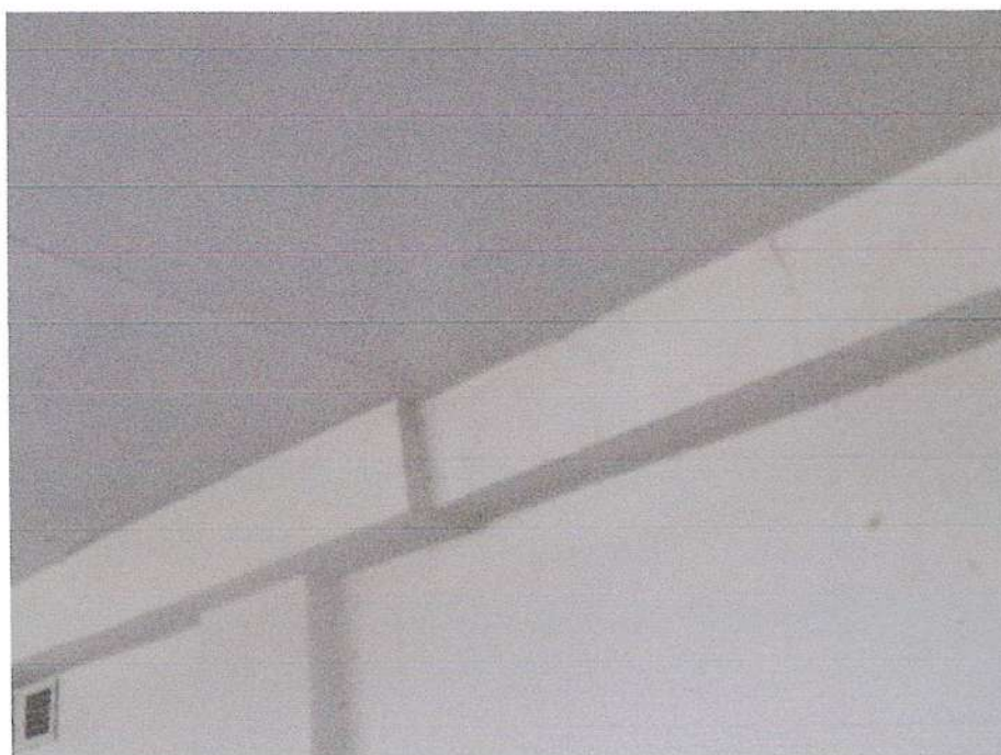
Նկ. 3 Շրջանակների սյուների ու պարզունակների միացման հանգույցներում տարանջատման ճաքերի տեսքը

✚ Մասնաշենքի երկաթբետոնե կոնստրուկցիաները ունեն 32-35ՄՊա, իսկ նկուղի պատերի բետոնի փաստացի ամրությունը 26-28ՄՊա (նկ.4):