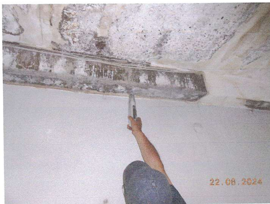
Նկ. 4 Մասնաշենքի երկաթբետոնե կոնստրուկցիաների ամրության որոշման գործընթացը