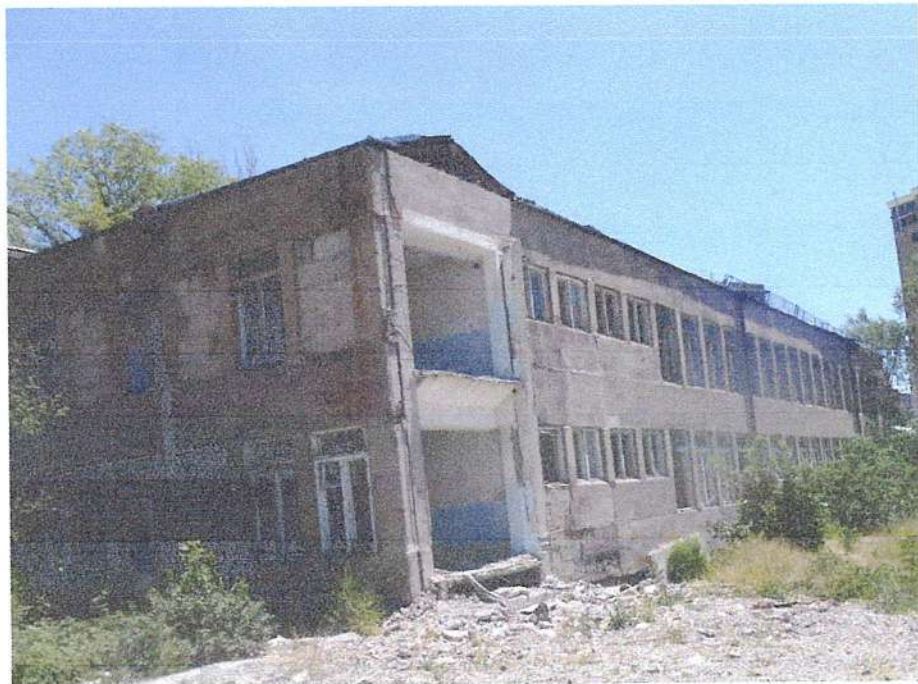
Նկ. 1 Մասնաշենքի տեսքը

Զննվող «Ե» մասնաշենքը հատակագծում ուղղանկյունաձև ուրվագծով, ~12,0x36,0մ առանցքային եզրաչափերով, 2 հարկանի, նկուղով, հասարակական գործառնական նշանակության, դպրոցի համալիրի կազմի մեջ մտնող կառույց է (նկ.1):